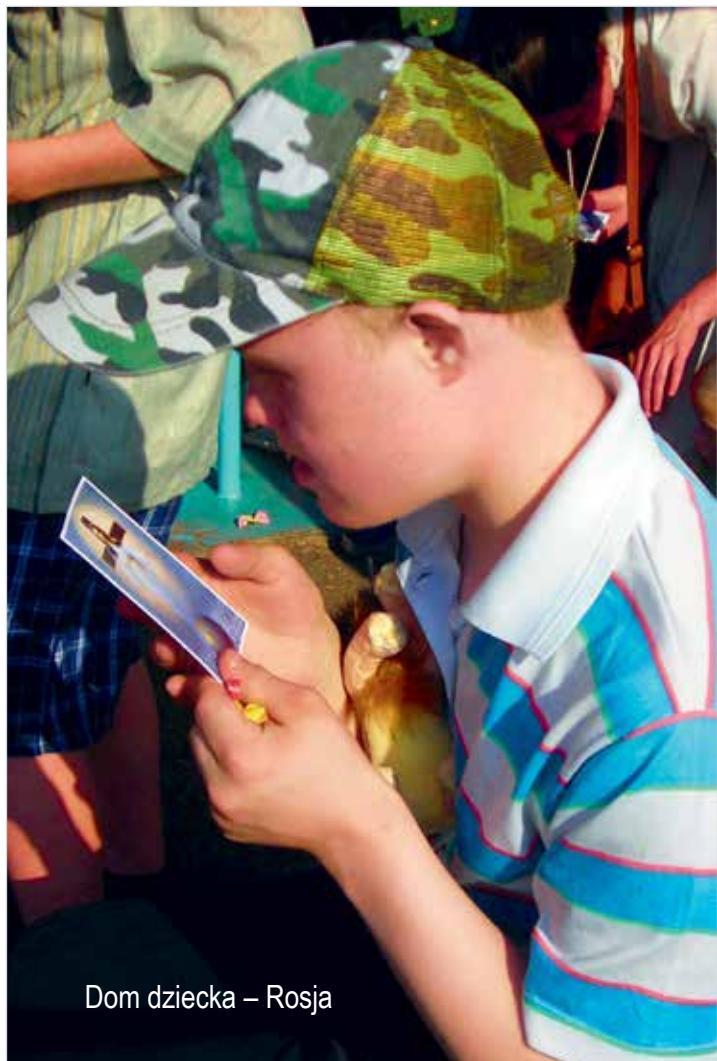
Dom dziecka – Rosja