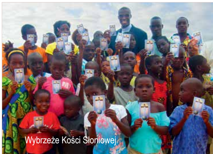
Wybrzeże Kości Słoniowej