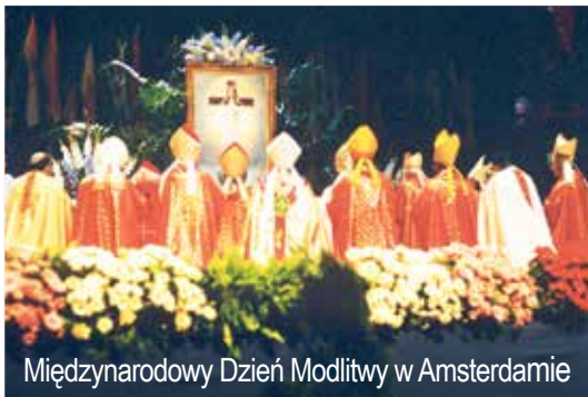
Międzynarodowy Dzień Modlitwy w Amsterdamie