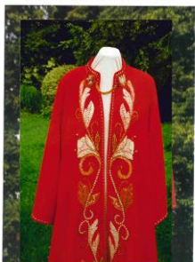
Musisz Krolowal chwały na wstecz ciał Jaka Lad Belp wstecz swego Boga i Króla