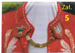
Placsz krolowej chwały dla Pana Jezusa miłosierdnego Na wstecz ciał Jaka Lad Belp wstecz swego Boga i Króla

Zał. Nr. 3 - Kościół Najświętszego Salwatora w Krakowie. Według informacji ze starych Kronik czytamy: „Kościół ten posiada za poprzednią stroną, jest w tym Kościele Krucyfiks na altaryzu, w koronie złotej i szacie haftowanej, pamięć Krucyfiksa do Misłowa, pierwszego chrześcijańskiego miasta w Polsce, od niego tak ubrano”. Zarówno malarszy