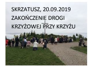
SKRZATUSZ, 20.09.2019 ZAKOŃCZENIE DROGI KRZYŻOWEJ PRZY KRZYŻU