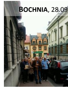
BOCHNIA, 28.09.2019 – XII EDYCJA KORONKA NA ULICACH MIAST ŚWIATA