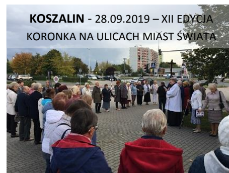
KOSZALIN - 28.09.2019 – XII EDYCJA KORONKA NA ULICACH MIAST ŚWIATA