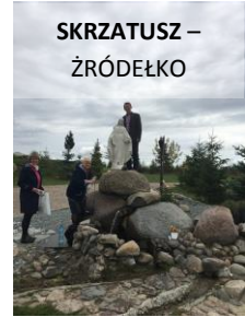
SKRZATUSZ – ŹRÓDEŁKO