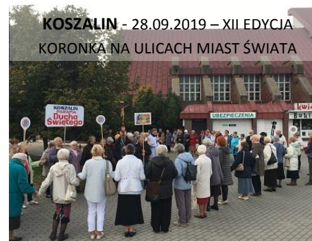
KOSZALIN - 28.09.2019 – XII EDYCJA KORONKA NA ULICACH MIAST ŚWIATA