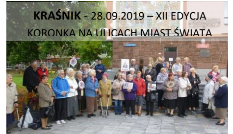
KRAŚNIK - 28.09.2019 – XII EDYCJA KORONKA NA ULICACH MIAST ŚWIATA