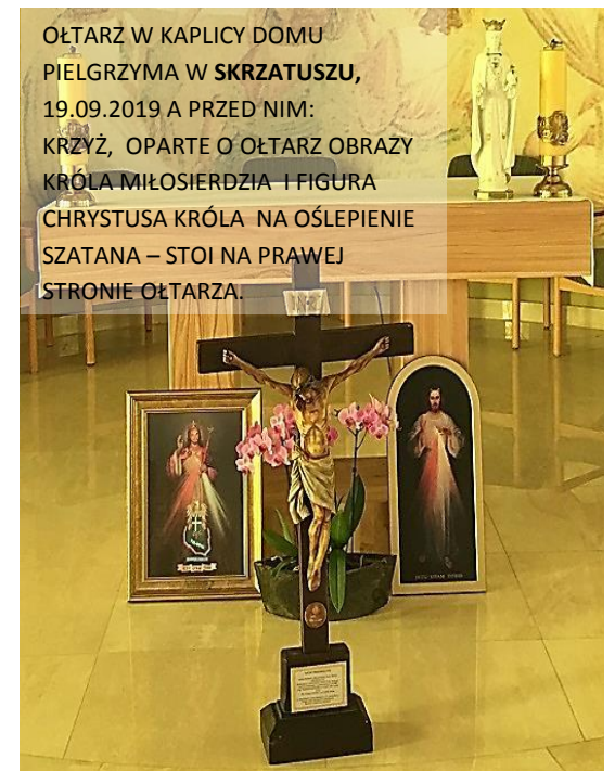
ÓLTARZ W KAPLICY DOMU PIELGRZYMA W SKRZATUSZU , 19.09.2019 A PRZED NIM: KRZYŻ, OPARTE O ÓLTARZ OBRAZY KRÓLA MIŁOSIERDZIA I FIGURA CHRYSTUSA KRÓLA NA OŚLEPIENIE SZATANA – STOI NA PRAWEJ STRONIE ÓLTARZA.