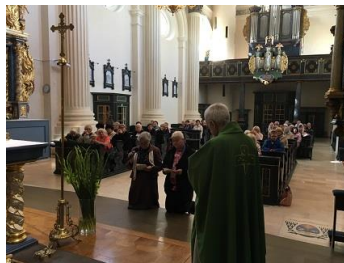
FOTORELACJA Z II REKOLEKCI W SANKTUARIUM MB BOLESNEJ W SKRZATUSZU, 19-22.09.2019 R.P.