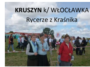
KRUSZYŃ k/ WŁOCŁAWKA Rycerze z Kraśnika