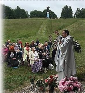
FOTORELACJA z I-ej WIZYTY DELEGACJI LEGIONU MRMSJ U KRÓLEWIEJ ŚWIATA - [PWN] W DOMACYNIE, 20.06.2020